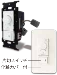
片切スイッチ 化粧カバー付